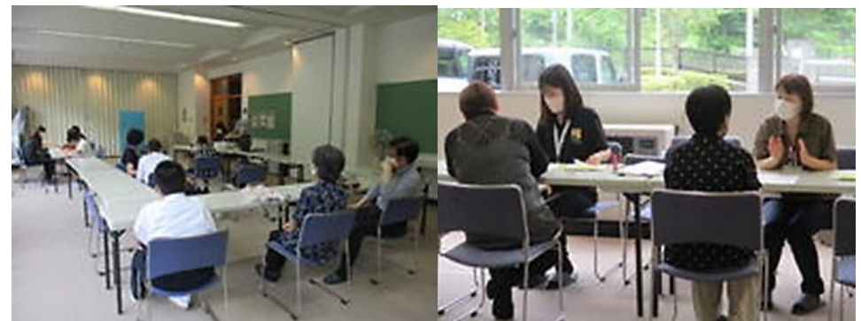
出張申請受付の様子