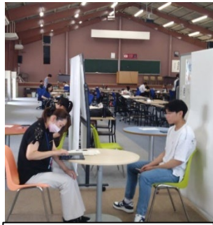
出張申請受付の様子