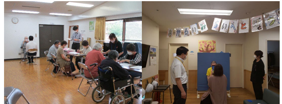
出張申請受付の様子